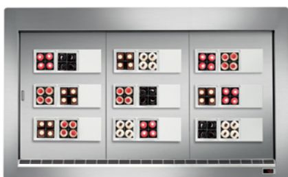
Acciaio inox Scotch-Brite Scotch-Brite stainless steel