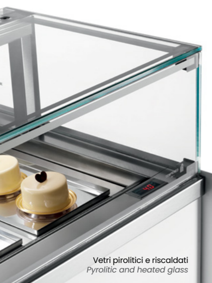
Vetri pirolitici e riscaldati Pyrolytic and heated glass