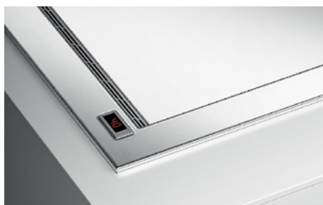
Incasso con cornice h 10 mm Installation with h 10 mm/0,39" frame