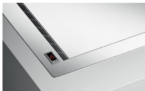
Incasso a filo Flush installation