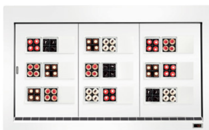
Bianco opaco RAL 9010 (non disponibile per il servizio Gelato) Matt white RAL 9010 (not available for Gelato service)